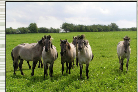
Bild: Konikpferde: Charakteristisch sind die hellgraue Färbung und der dunkle Aalstrich.