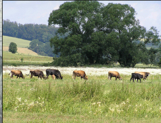
Bild links: Heckrinder: Typisch ist die unterschiedliche Färbung von Stier, Kuh und Kalb.